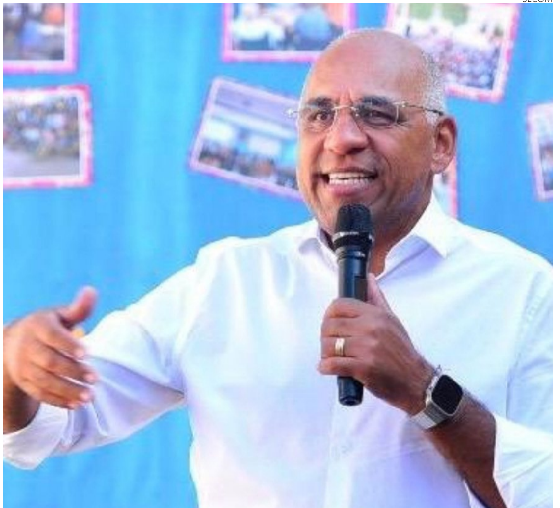
Prefeito Rogério Cruz: “Implantamos o sinal de internet 5G, que em março deste ano passou a alcançar toda Goiânia”

Uma Parceria Público-Privada foi estabelecida para ampliar o monitoramento, possibilitando o acesso do Centro de Controle Integrado a câmeras privadas externas.