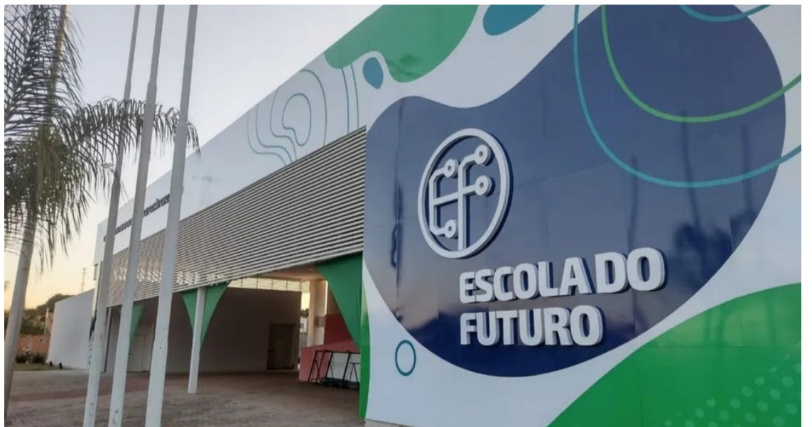
Escola do Futuro em Mineiros abriu 30 vagas para o curso de Ciências de Dados — Foto: Reprodução.

Com inscrições abertas para 204 vagas em cursos técnicos gratuitos, as oportunidades estão distribuídas em áreas de alta demanda, como Ciência de Dados, Desenvolvimento Web e Mobile, e Marketing e Mídias Sociais. As demais cidades beneficiadas são Goiânia, Aparecida de Goiânia, Santo Antônio do Descoberto e Valparaíso de Goiás.