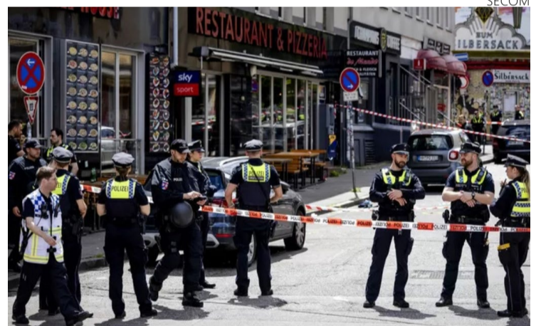
Autoridades estabeleceram perímetro de segurança e descartaram relação com o evento esportivo

landa e Polônia ocorreu sem maiores problemas, com a Holanda vencendo por 2 a 1, graças a um gol de Wout Weghorst nos minutos finais. Os holandeses fazem parte do Grupo D da Eurocopa 2024, junto com França, Áustria e Polônia, e enfrentarão a França e a Áustria nos próximos jogos. O incidente em Hamburgo destacou os desafios de segurança durante grandes eventos internacionais, mas a torcida holandesa manteve seu espírito festivo, demonstrando a capacidade do futebol de unir pessoas e superar adversidades.