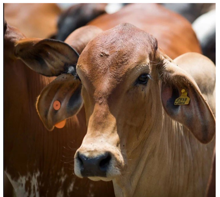
Melhora no preço do boi gordo acende esperança; veja cotações

O dólar comercial encerrou a sessão em queda de 0,70%, sendo negociado a R$ 5,3670 para venda e a R$ 5,3650 para compra. Durante o dia, a moeda norte-americana oscilou entre a mínima de R$ 5,3620 e a máxima de R$ 5,4153.