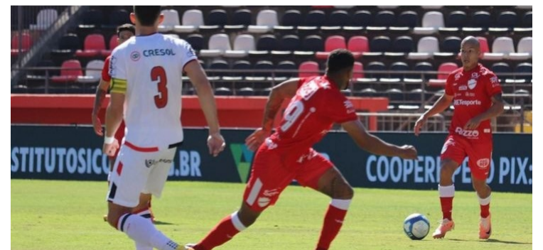
Vila Nova nadou, mas morreu na praia em jogo pela série B: Pantera fez e segurou placar

Tigrão perdeu ontem para Botafogo de São Paulo em disputa da série B. Colorado segue distante do grupo de acesso