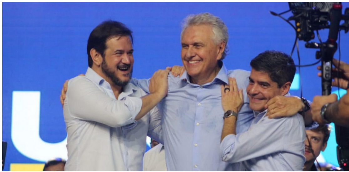
Antonio Rueda, Ronaldo Caiado e ACM Neto: União Brasil unido para lançar nome ao Planalto

Senador do Paraná, Sérgio Moro lembrou das perseguições que tem sofrido e alertou o partido: a disputa de 26 não será fácil, mas o UB tem nomes