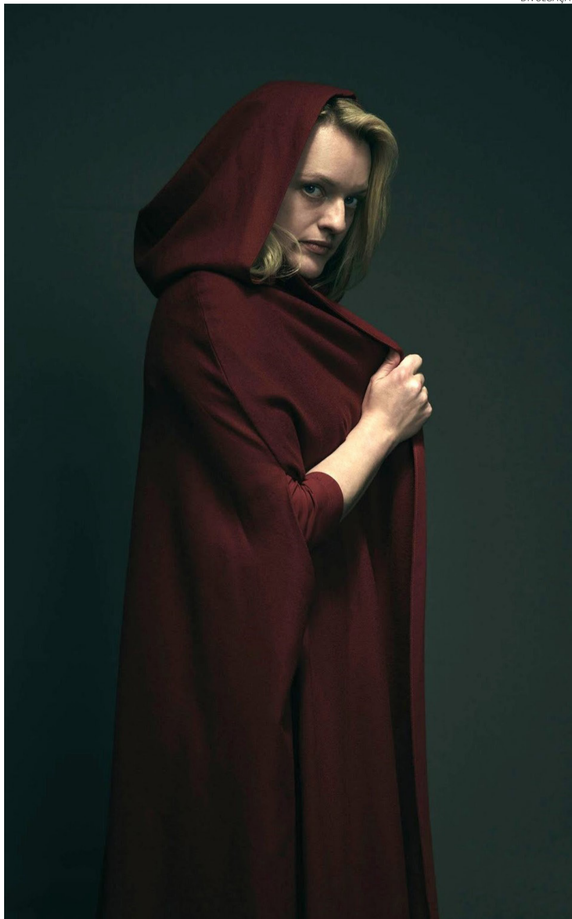
Elisabeth Moss interpreta June Osborne em 'O Conto da Aia'

Caso o projeto seja aprovado nas duas do Congresso e sancionado pelo presidente, a mu-