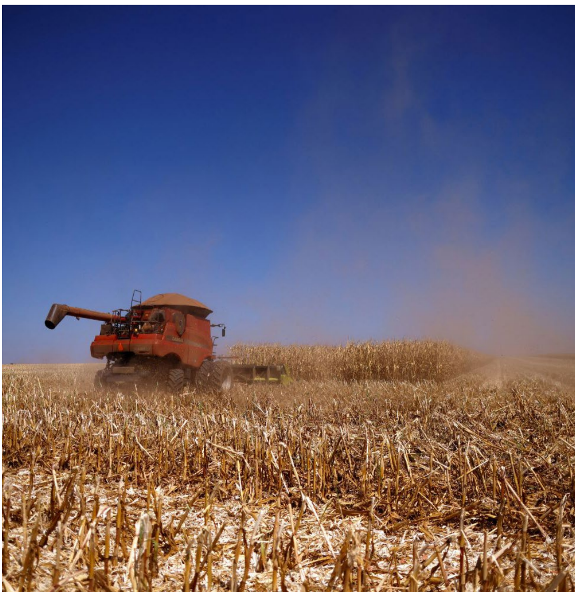
Plantação de milho em fazenda próxima à Brasília – Foto: Reuters.

A produção total de grãos e oleaginosas do Brasil em 2023/24 foi estimada em 297,54 milhões de toneladas, acima das 295,45 milhões de toneladas do levantamento anterior, baixa de 7% na comparação anual, consequência “das condições climáticas adversas que influenciaram as principais regiões produtoras do país”.