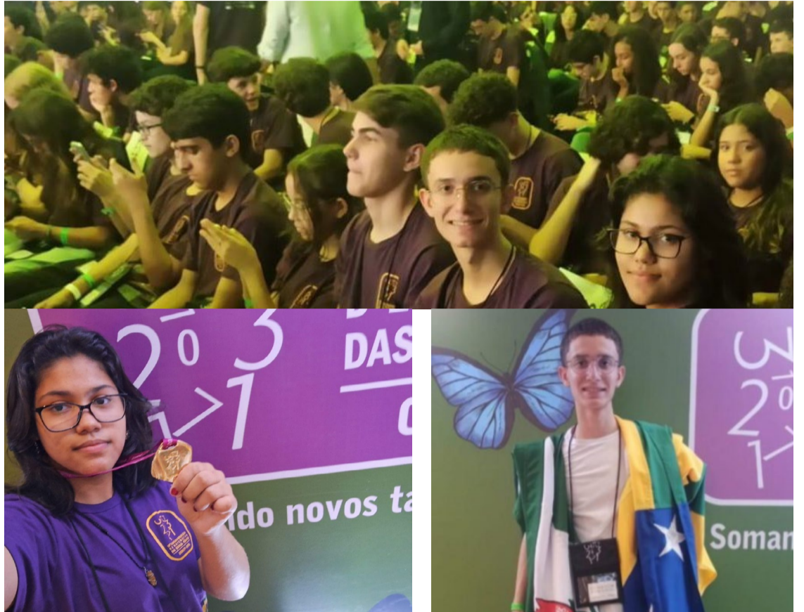
Qualidade do ensino nas redes municipal e estadual de Rio Verde foram reconhecidas nacionalmente