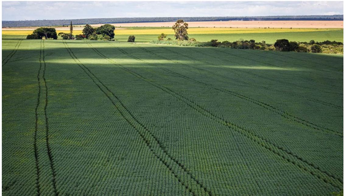
BC prevê gasto de R$ 12 bilhões com Proagro EM 2024