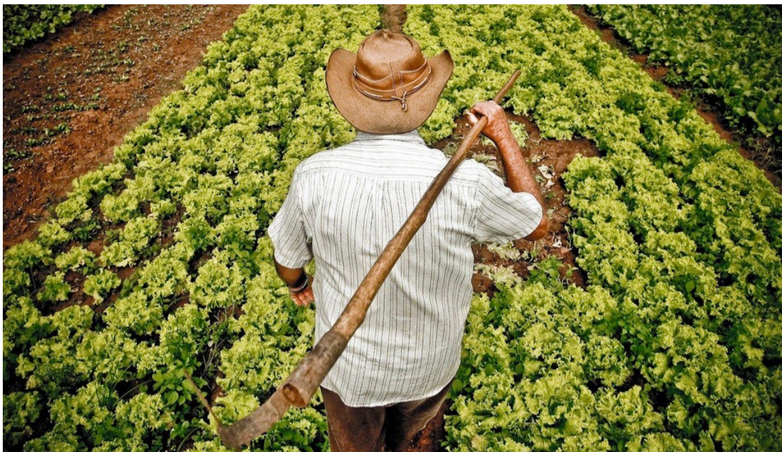
Governo deve destinar mais de R$ 100 bilhões à agricultura familiar

A Confederação da Agricultura e Pecuária do Brasil (CNA) reivindicou em abril ao governo