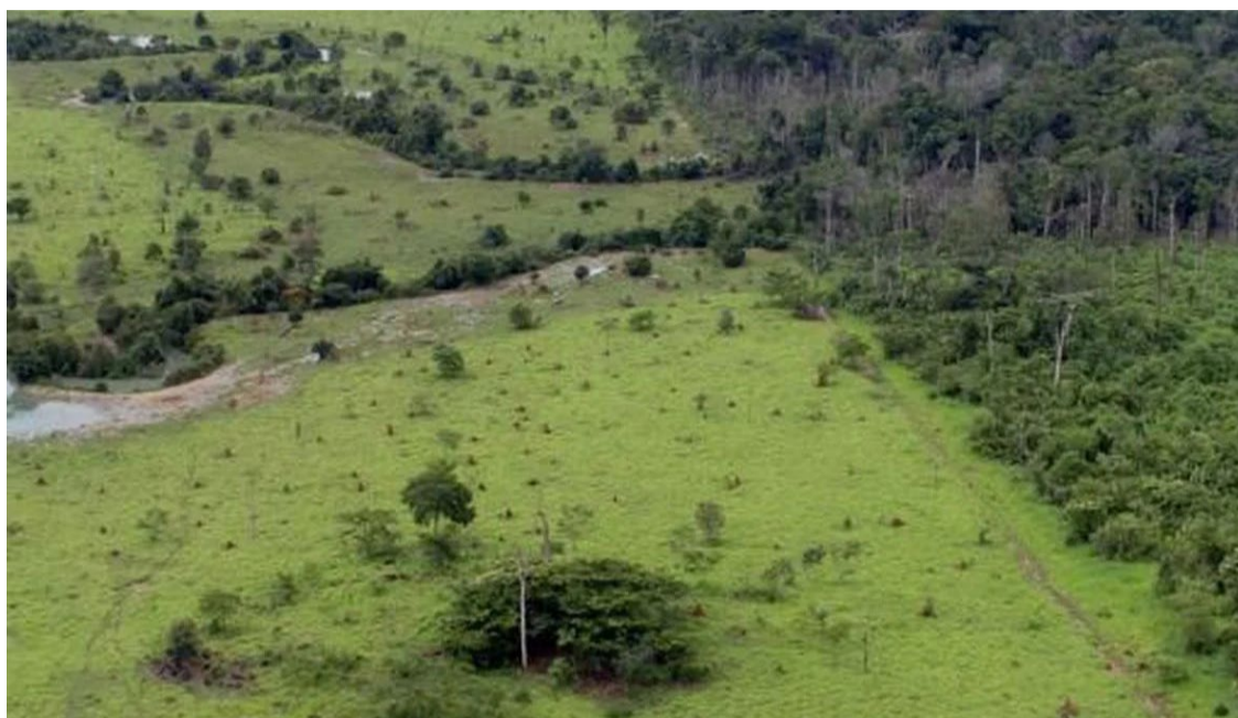
Agronegócio avança rumo à sustentabilidade em meio a desafios crescentes

Consumidores e investidores estão cada vez mais atentos a essas questões, e empresas que não se adaptarem a essas demandas correm o risco de perder espaço no mercado global. Por isso, companhias que lideram a transformação para uma economia mais verde e sustentável conseguem mitigar riscos